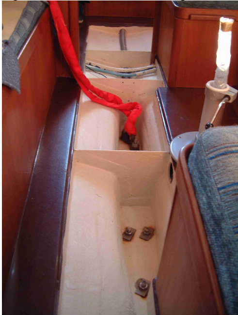
Bild 1. Tre stycken bottenstockar. Bilden tagen förifrån.

Valet stod mellan att genomföra förstärkning själva eller lämna projektet till varv. Vintern stod för dörren och även om vi är ganska händiga hade vi inte riktigt förutsättningar för att genomföra jobbet. Vi ville inte vänta. Valet av varv föll på Plast och Marinteknik Arne Olsén AB. Varvet ligger i Jordbro Industriområde en bra bit från land men eftersom dom har egen semitrailer för båttransporter löste sig transporten från vatten i Karlstad till sjösättning på våren smidigt. Vinterförvaringen löste sig således även första säsongen.