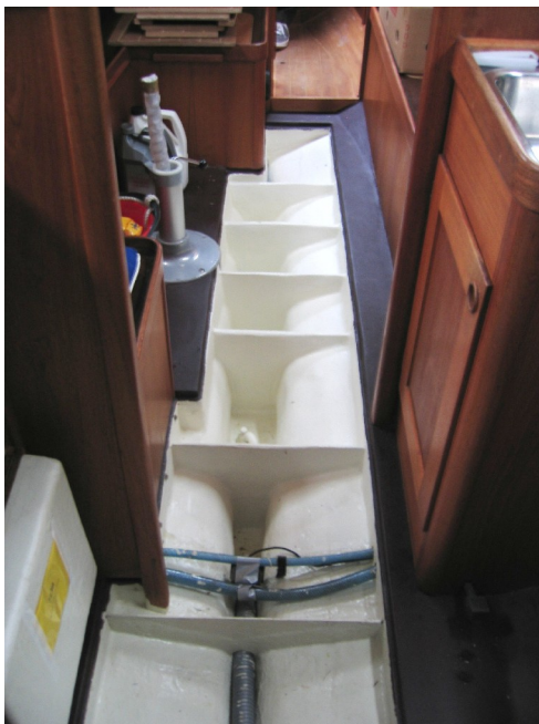
Bild 2. Nya och förstärkta bottenstockar på Timjan. Bild tagen akterifrån.

Slutresultatet ser ni i bild 2. Sex bottenstockar jämnt fördelade längs kölfickan. Lägg märke till att bottenstocken längst akterut har lämnats utan förstärkning. Troligen är skrovet där tillräckligt styvt med avseende på svajköl.